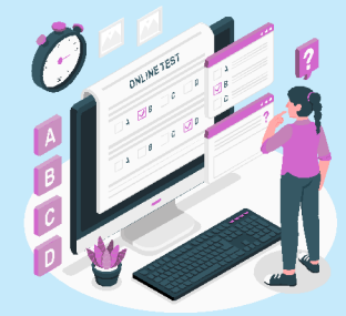
Live/Recorded Online Program